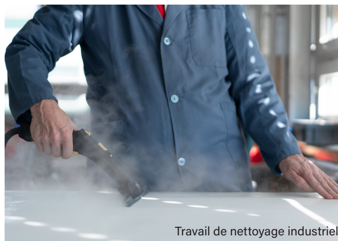
Travail de nettoyage industriel

Je tiens encore à exprimer toute ma reconnaissance aux collaborateurs, au personnel d'encadrement, ainsi qu'à toutes les personnes qui œuvrent quotidiennement pour garantir la qualité de l'ensemble de nos prestations et la satisfaction de nos clients. ■