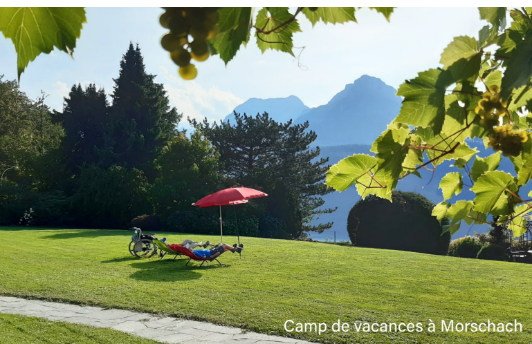
Camp de vacances à Morschach

Après avoir dû renoncer en 2020 à notre traditionnel séjour de vacances en commun, le camp 2021 a eu une saveur toute particulière. C'est dans un cadre idyllique, dans le petit village de Morschach surplombant le lac des Quatre-Cantons, que les résidents ont pu profiter d'une semaine de vacances truffée de moments privilégiés. Si de telles activités récréatives peuvent être maintenues régulièrement, c'est principalement grâce à la générosité de nos donateurs, que nous remercions infiniment. Avec un encadrement assuré 24 heures sur 24 et ceci 365 jours par année, il est nécessaire de disposer d'une solide organisation. L'efficacité de l'équipe étant un élément vital pour le bon fonctionnement d'une structure comme la nôtre, je tiens à remercier l'ensemble du personnel du Foyer pour son engagement permanent et la qualité du travail fourni tout au long de l'année. ■